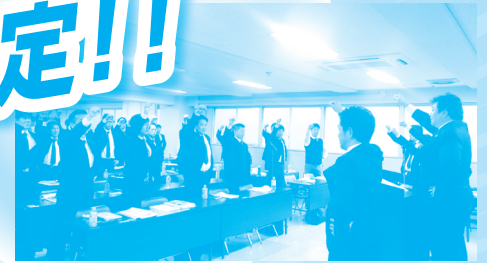
全員でのガンパロー三唱