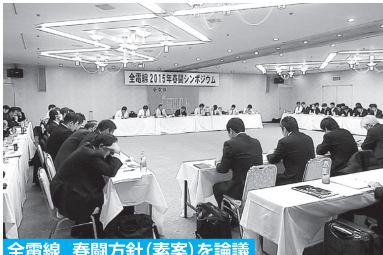
全電線 春闘方針(素案)を論議