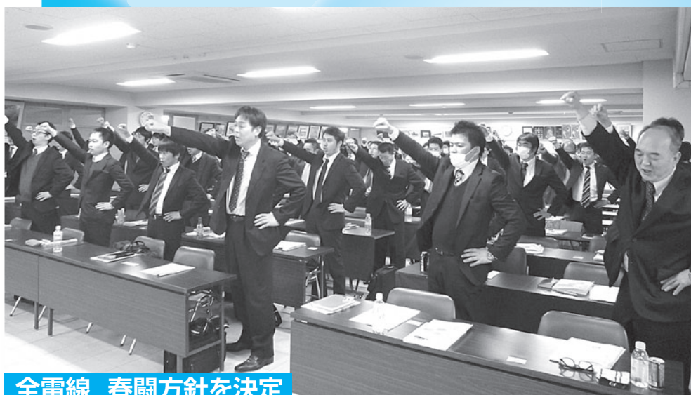
全電線 春闘方針を決定