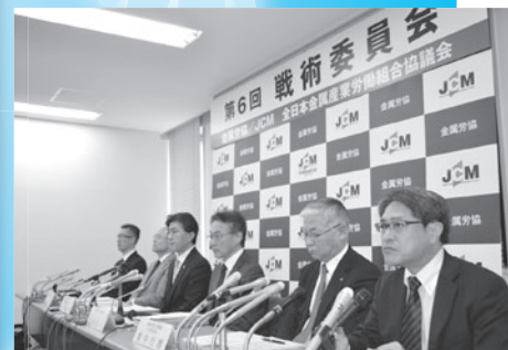
JCM 集中回答日記者会見