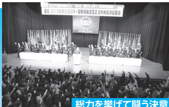
総力を挙げて闘う決意