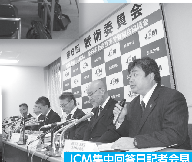
JCM集中回答日記者会見