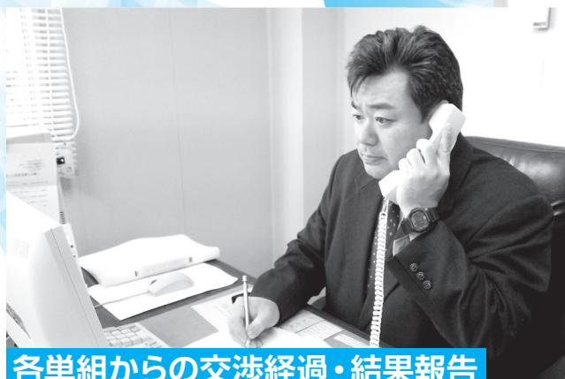
各単組からの交渉経過・結果報告